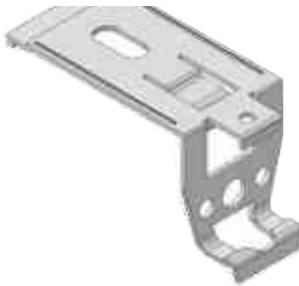
clips fixare șină și profil de mascare