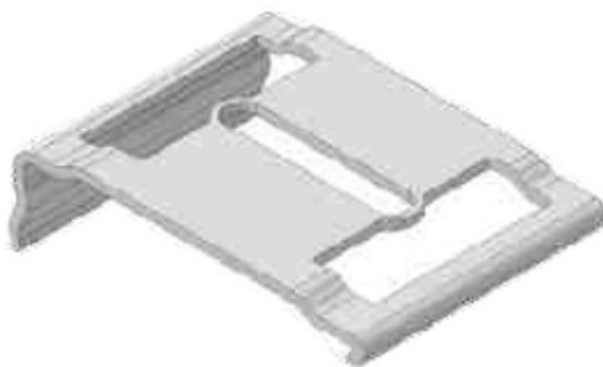
clips fixare șină